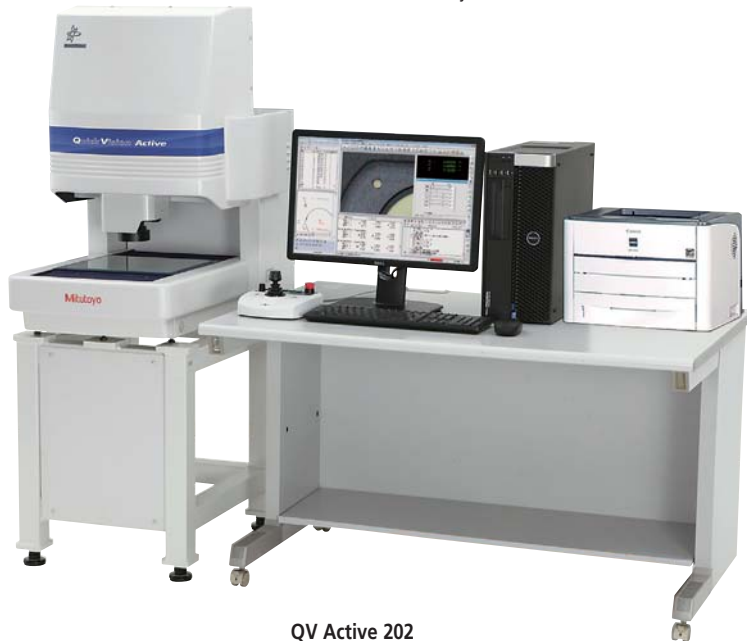
QV Active 202