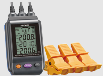
非接觸式電壓/相序表 PD3259-50